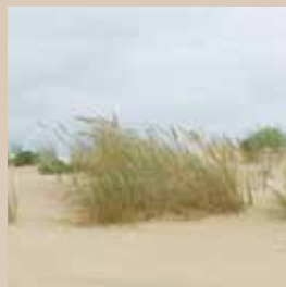
Dunes de sables